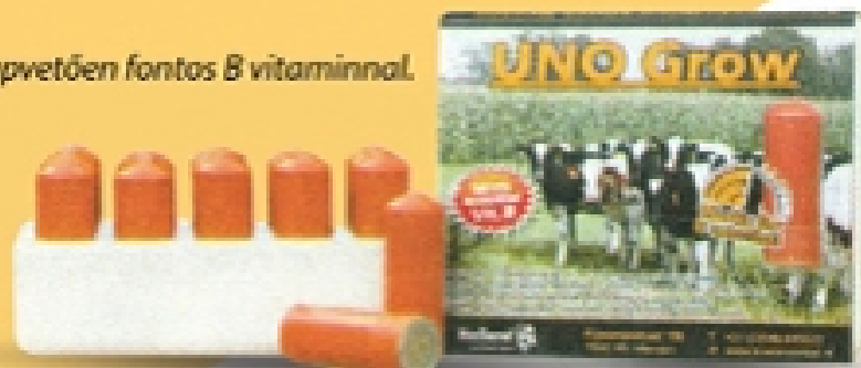
Szelén és E vitamin nagy mennyiségben

Csomag mérete: 20 kapszula (elegendő 10 tehénnek)