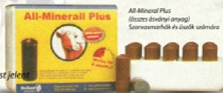
All-Mineral Plus (összes ésványi anyag) Szarvasmarhák és üredek számára