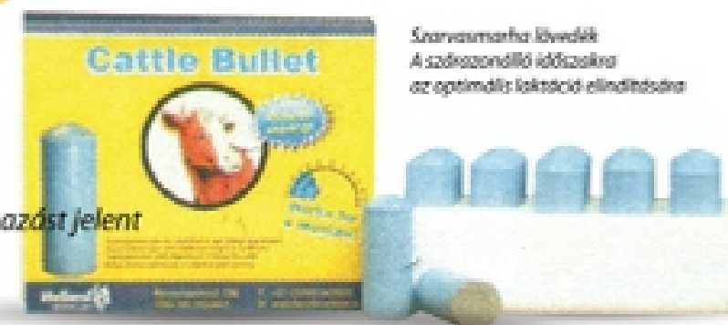
Szarvasmarha lővelék A szárazonálló időszakra az optimális laktáció-ellátásért

Csomagolás mérete: 20 kapszula (elegendő 10 tehénnek)